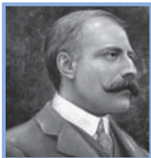
Edward Elgar (1857-1934)

Här är Edward Elgar allmänt mest känd för "Pomp and Circumstance", march nr 1 på Last Night of the Proms. Men hans meritlista som kompositör är avsevärd och bland större verk är "Gerontius dröm" en favorit i England.